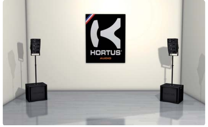
CBA-10M/S : 单声通道或立体声放大+ 内置 DSP